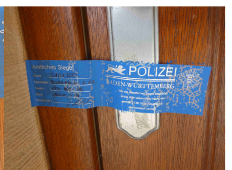
Versiegelungen 30./31.01. – 30.06.2020 intakt – Trotzdem Rollo 2. Fenster unter Balkon hochgezogen. Kellerzutritt?