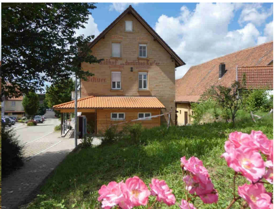
01. Februar 2020 Beerdigung der Familie Schurr & Poisel